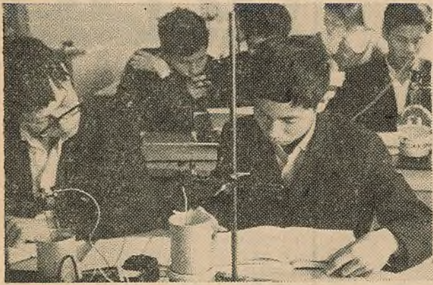
Падыходзяць к канцу заняткі на падрыхтоўчым факультэце. Яшчэ раз правяраюць свае веды перад сесіяй студэнты-в'етнамцы.