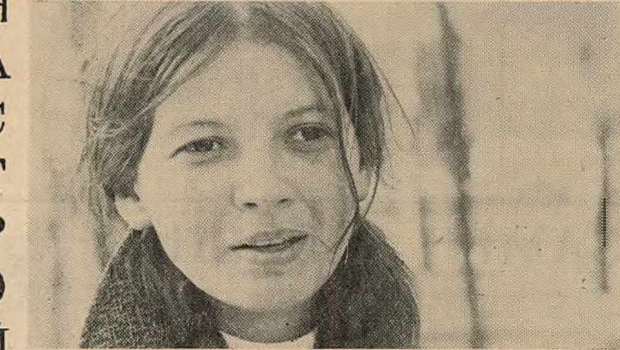
ПЕШАХОД І ВУЛІЦА